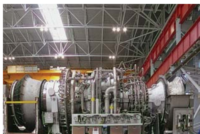
Фото 14. ГТУ MS5002E, изготовленная по третьей фазе локализации на участке агрегатирования производственной площадки «РЭП Холдинга»

Всего для объектов ОАО «Газпром» произведены 24 агрегата нового поколения ГПА-32 «Ладога» с приводом от ГТУ MS5002E, изготовленные по различным фазам локализации. 22 из них уже отгружены на компрессорные станции системы магистральных газопроводов «Бованенково – Ухта» и для реконструкции КС «Грязовец» и КС «Вавожская». Введены в эксплуатацию агрегаты на