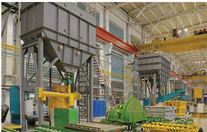
Фото 5. Формовка модельных комплектов на производственной площадке «РЭП Холдинга»

– подписана программа долгосрочного сотрудничества с ОАО «Газпром» по 2020 год, предусматривающая производство и внедрение современного высокотехнологичного газоперекачивающего оборудования на ключевых объектах реконструкции и нового строительства в рамках развития системы магистральных газопроводов. В программе, в частности, прописаны мероприятия по расширению мощностного ряда производимого оборудования, которые позволят наладить разработку и серийный выпуск в России конкурентоспособных газотурбинных и электроприводных газоперекачивающих агрегатов и электростанций.