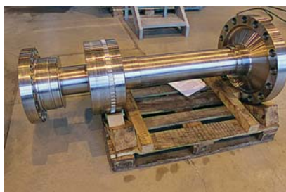
Фото 11. Детали ротора ТНД и ТВД производства «РЭП Холдинга»