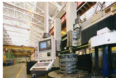
Фото 7. Обработка корпуса компрессора на производственной площадке «РЭП Холдинга»