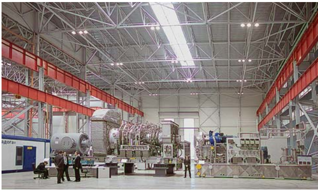
Фото 16. Комплектная поставка оборудования на станцию в производственном цехе «РЭП Холдинга»