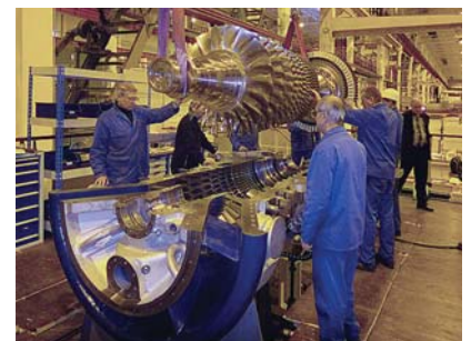
Фото 10. Установка (укладка) ротора