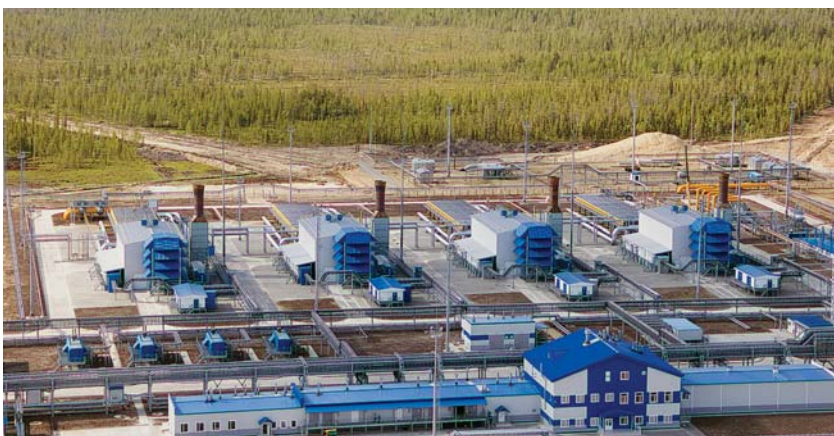
Фото 18. Агрегаты ГПА-32 «Ладога» с приводом от ГТУ MS5002E на КС-8 «Чикшинская»