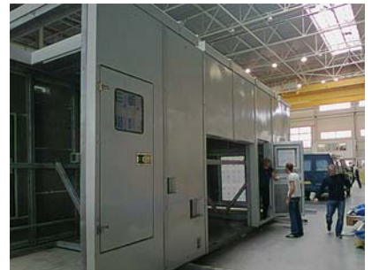
Фото 4. Сборка КШТ на производственной площадке «РЭП Холдинга»