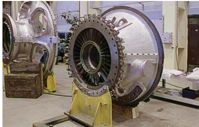
Фото 8. Корпуса ГТД производства «РЭП Холдинга», готовые к сборке

■ сборки ГТД (фото 10) на сборочном и испытательном стенде.