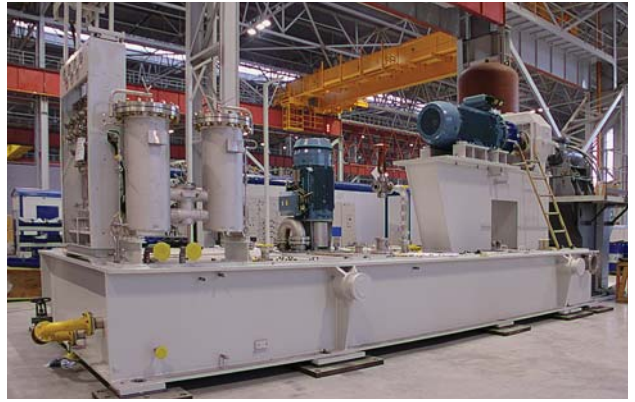
Фото 3. РВУ, изготовленная по первой фазе локализации