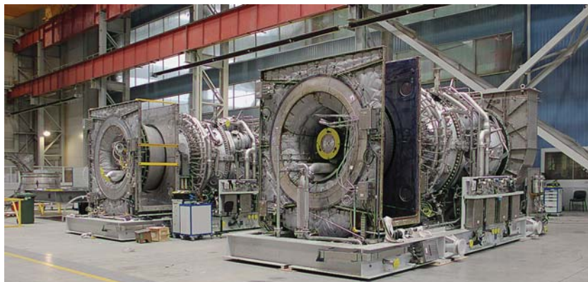
Фото 1. Серийное производство ГТУ MS5002E на производственной площадке «РЭП Холдинга» – «Невский завод»

По данному соглашению уже произведено и отгружено на объекты ОАО «Газпром» 22 агрегата, которые доказали свою надежность и успешно эксплуатируются на компрессорных станциях.