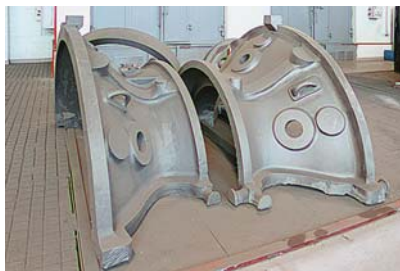
Фото 6. Отливки корпусных частей турбины на металлургическом производстве «РЭП Холдинга»

■ трубной и электрической обвязки рамы турбины и самой турбины;