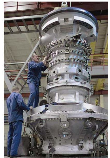
Фото 9. Сборка корпусов, вертикальное выравнивание

– подписано лицензионное соглашение с компанией Solar о локализации производства газоперекачивающих агрегатов мощностью 22 МВт.