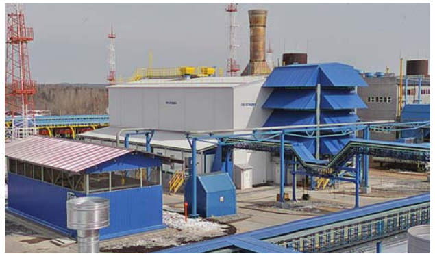
Фото 17. ГПА-32 «Ладога» на компрессорной станции «Вавожская» с приводом от ГТУ MS5002E

КС «Вавожская» (фото 17) – 1 и 2, «Грязовец», четыре станционных ГПА-32 «Ладога» на КС-8 «Чикшинская» (фото 18), изготовлены и монтируются агрегаты для КС «Сынинская», «Малоперанская», «Интинская». Проведены испытания двух агрегатов для КС «Русская».