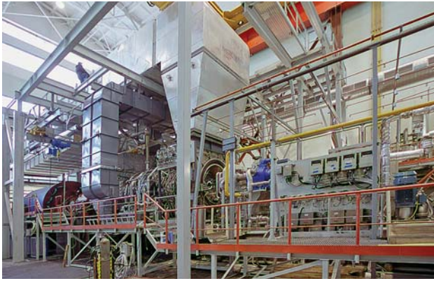
Фото 2. Испытательный стенд ГТУ MS5002E на производственной площадке «РЭП Холдинга»