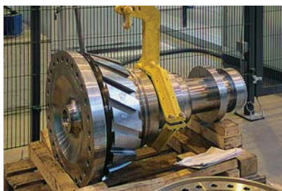
Фото 13. Центробежный компрессор 400-21-1С