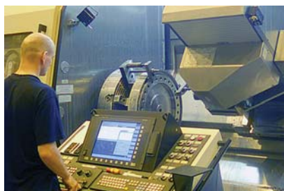
Фото 12. Обработка дисков ротора ТВД

турбины, в частности обрабатывающие центры для изготовления турбинных дисков, балансировочное оборудование и стеллажи для сборки роторов. Пополнился парк станков для обработки корпусов и крупногабаритных деталей. С целью повышения производительности модернизировано имеющееся металлообрабатывающее оборудование.